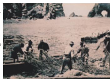
►Pescadores japoneses tomaron parte activa en la pesca en Takeshima y sus alrededores. (los años 30)

in the Declaration. As regards the island of Dokdo, otherwise known as Takeshima or Liancourt Rocks , this normally uninhabited rock formation was according to our information never treated as part of Korea and, since about 1905, has been under the jurisdiction of the Gki Islands Branch Office of Shimane Prefecture of Japan. The island does not appear ever before to have been claimed by Korea. It is understood that