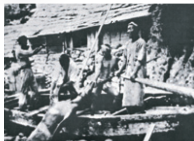
▲Compañía Pesquera deTakeshima, alrededor de 1909. (Foto: De "Estudio Histórico-Geográfico de Takeshima" por Kenzo Kawakami; Kokon Shoin)