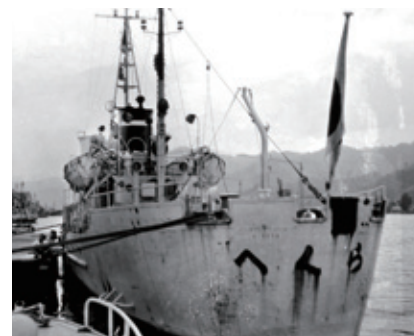
►Patrullera de la Guardia Costera de Japón atacada por la República de Corea cerca de Takeshima en julio de 1953."

Establecida unilateralmente por la República de Corea en contravención del Derecho Internacional